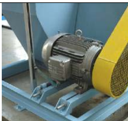
Motor Wmagnet + Inversor CFW11