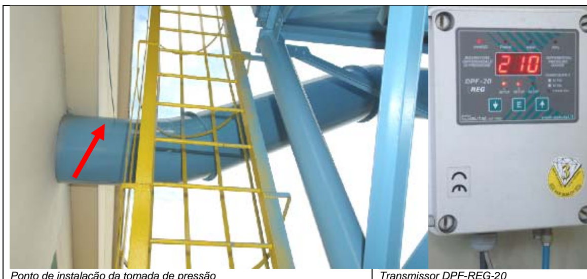
Ponto de instalação da tomada de pressão

2º Passo: Instalação do Transmissor de Pressão na tubulação de exaustão (entrada do filtro de mangas)